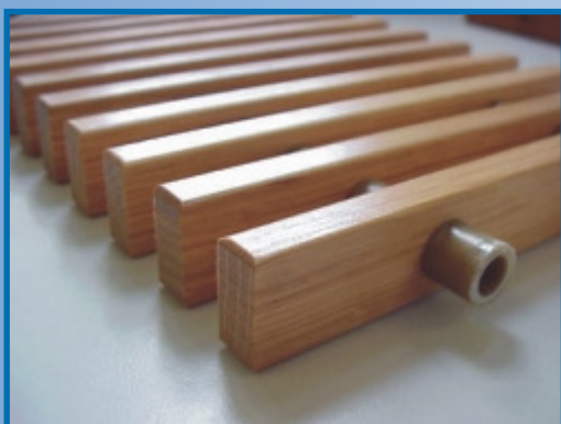
Original ADO ® -Bau H